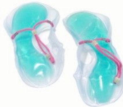
Yo Bubble gel slippers 149:-