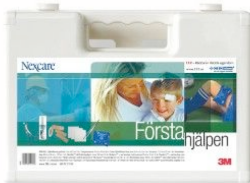
Första Hjälpen låda julpris 1399:- (ord. pris 1599:-)